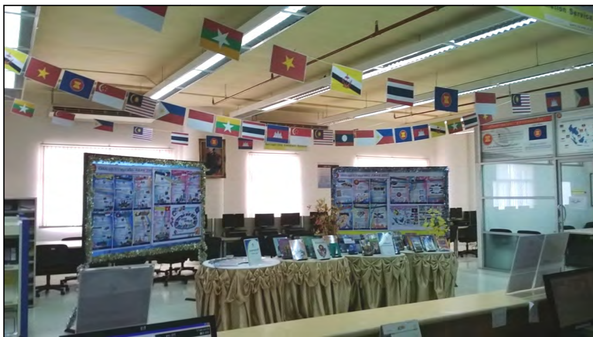
รูปภาพที่ 1 สำนักวิทยบริการขอยืมบอร์ดจากวิทยาลัยนครราชสีมา เพื่อใช้จัดนิทรรศการภายในสำนักฯ