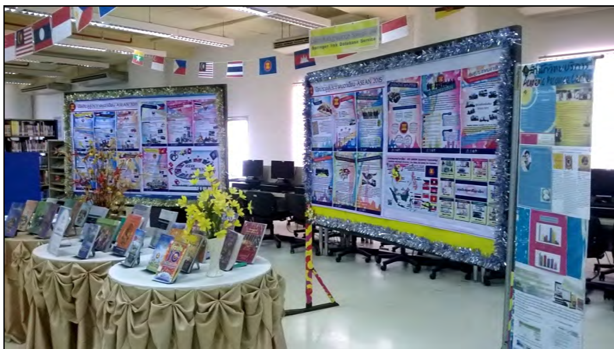
รูปภาพที่ 2 สำนักวิทยบริการขอยืมบอร์ดจากวิทยาลัยนครราชสีมา เพื่อใช้จัดนิทรรศการภายในสำนักฯ