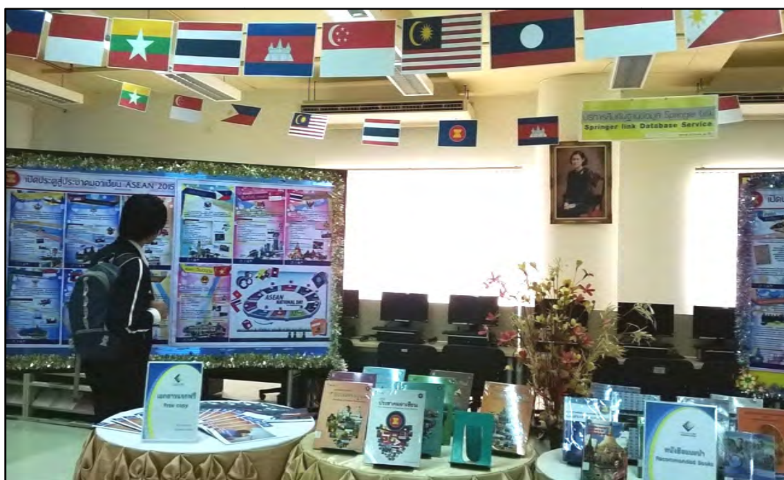
รูปภาพที่ 10 สำนักวิทยบริการจัดนิทรรศการให้ความรู้เรื่อง เปิดประตูสู่อาเซียน