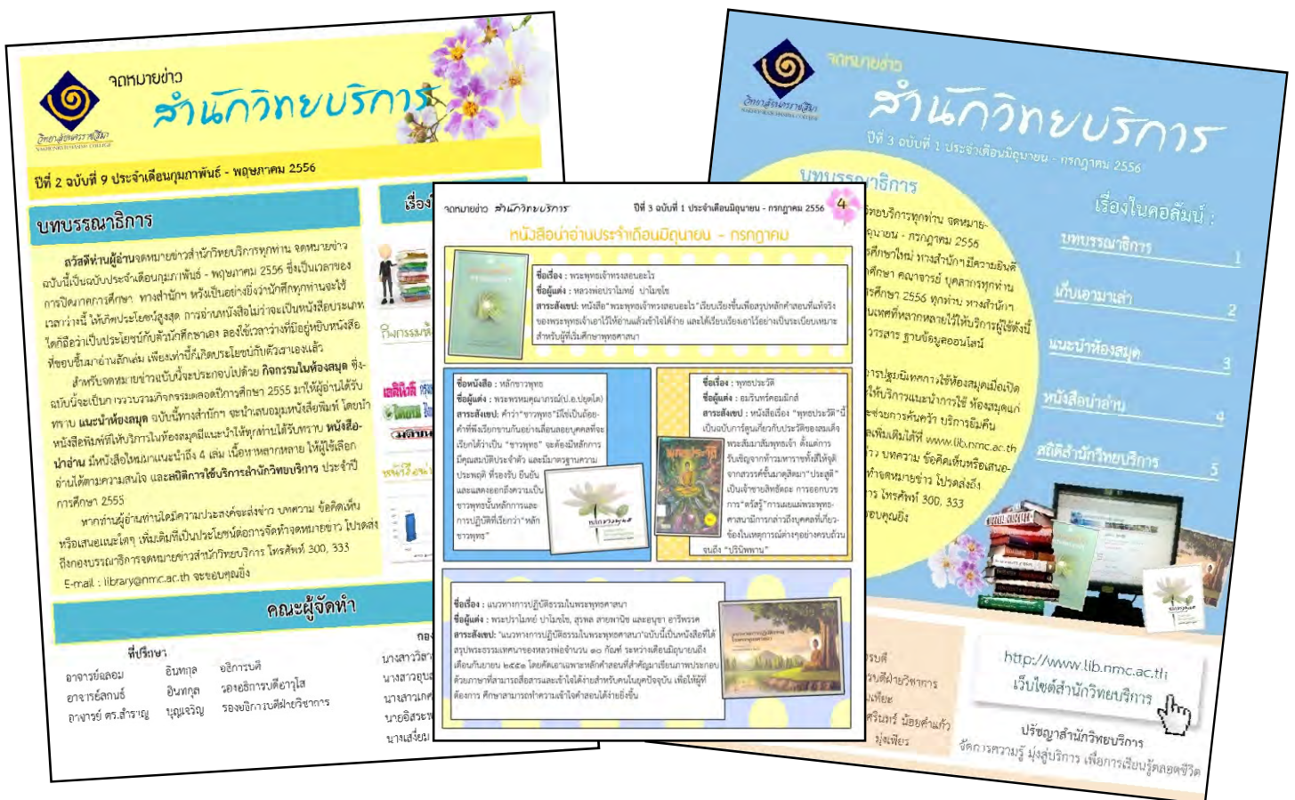
รูปภาพที่ 14 สำนักวิทยบริการรณรงค์การใช้ห้องสมุดผ่านทางจดหมายข่าว สำนักวิทยบริการ