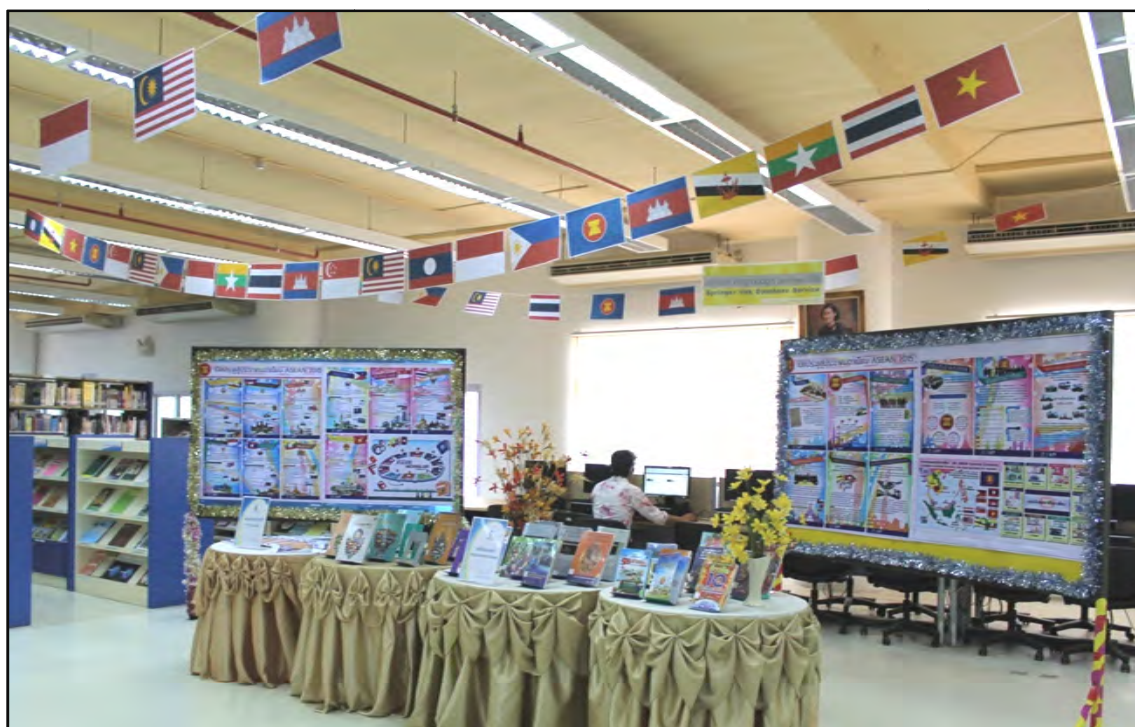
รูปภาพที่ 9 สำนักวิทยบริการจัดนิทรรศการให้ความรู้เรื่อง เปิดประตูสู่อาเซียน