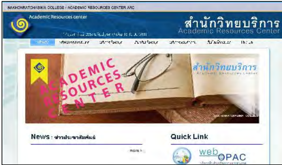
รูปภาพที่ 13 สำนักวิทยบริการรณรงค์การใช้ห้องสมุดผ่านทางเว็บไซต์ของสำนักฯ