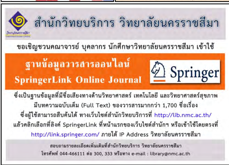
รูปภาพที่ 15 สำนักวิทยบริการรณรงค์การใช้ห้องสมุดผ่านสื่อประชาสัมพันธ์ต่างๆ