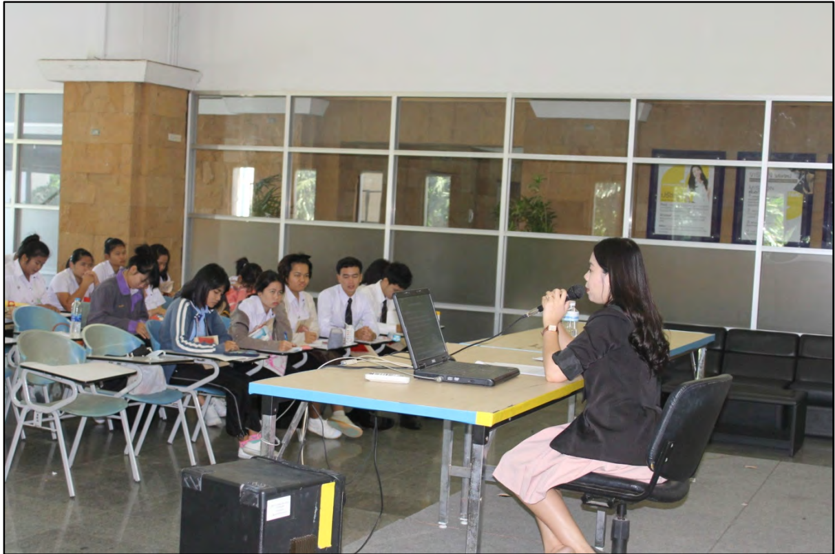
รูปภาพที่ 3 จัดอบรมการใช้ห้องสมุดให้แก่นักศึกษาใหม่