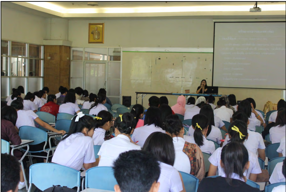
รูปภาพที่ 2 จัดอบรมการใช้ห้องสมุดให้แก่นักศึกษาใหม่