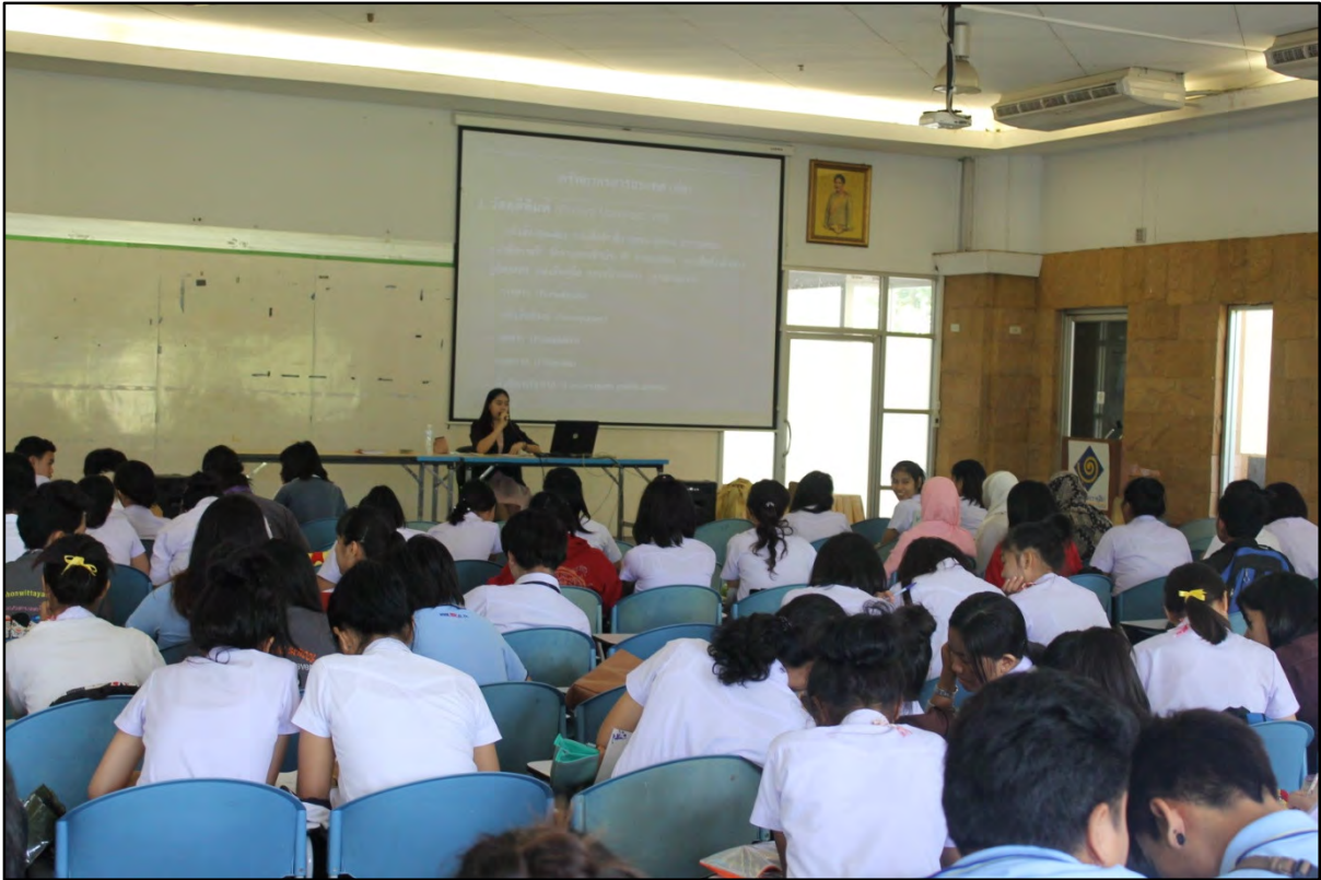
รูปภาพที่ 1 จัดอบรมการใช้ห้องสมุดให้แก่นักศึกษาใหม่