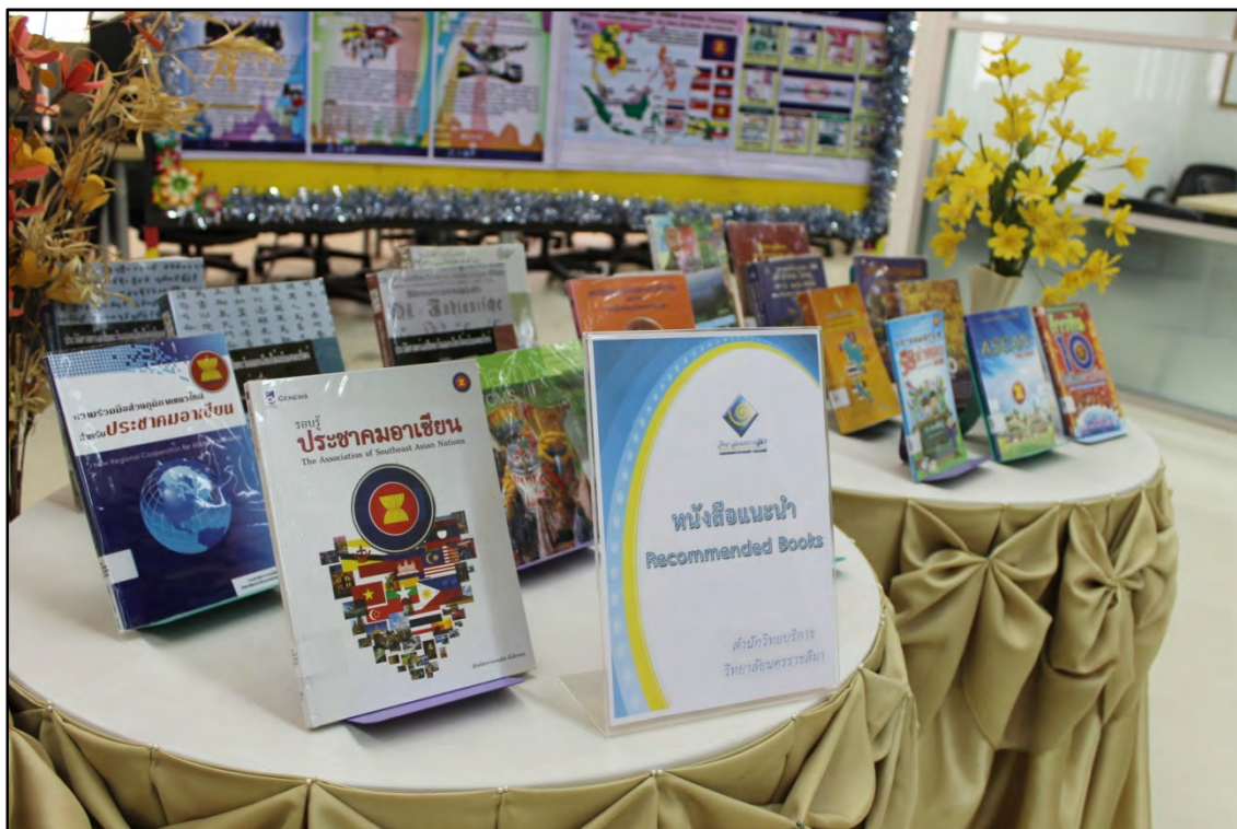
รูปภาพที่ 12 สำนักวิทยบริการจัดนิทรรศการให้ความรู้เรื่อง เปิดประตูสู่อาเซียน