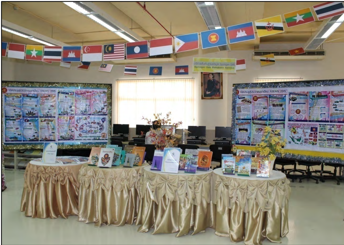
รูปภาพที่ 11 สำนักวิทยบริการจัดนิทรรศการให้ความรู้เรื่อง เปิดประตูสู่อาเซียน