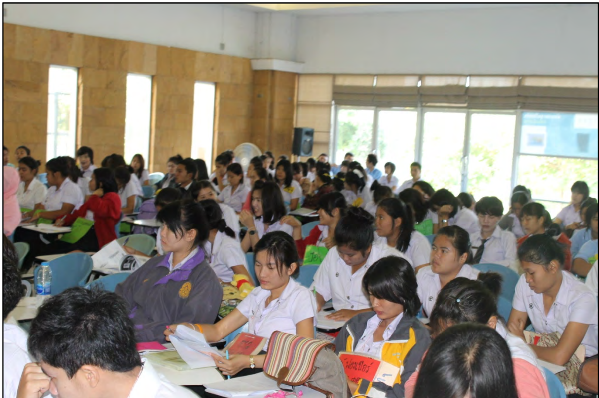
รูปภาพที่ 4 จัดอบรมการใช้ห้องสมุดให้แก่นักศึกษาใหม่