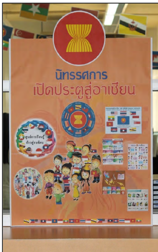
รูปภาพที่ 8 สำนักวิทยบริการจัดนิทรรศการให้ความรู้เรื่อง เปิดประตูสู่อาเซียน